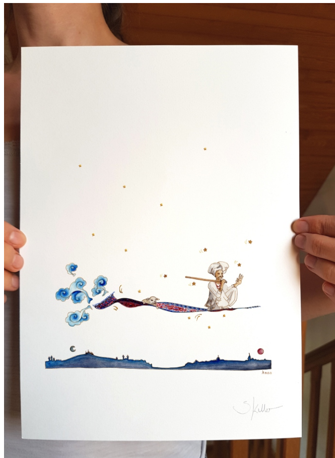
Exklusiv archiv-qualität Reproduktion „Rabari“. Kalam Kush Papier.