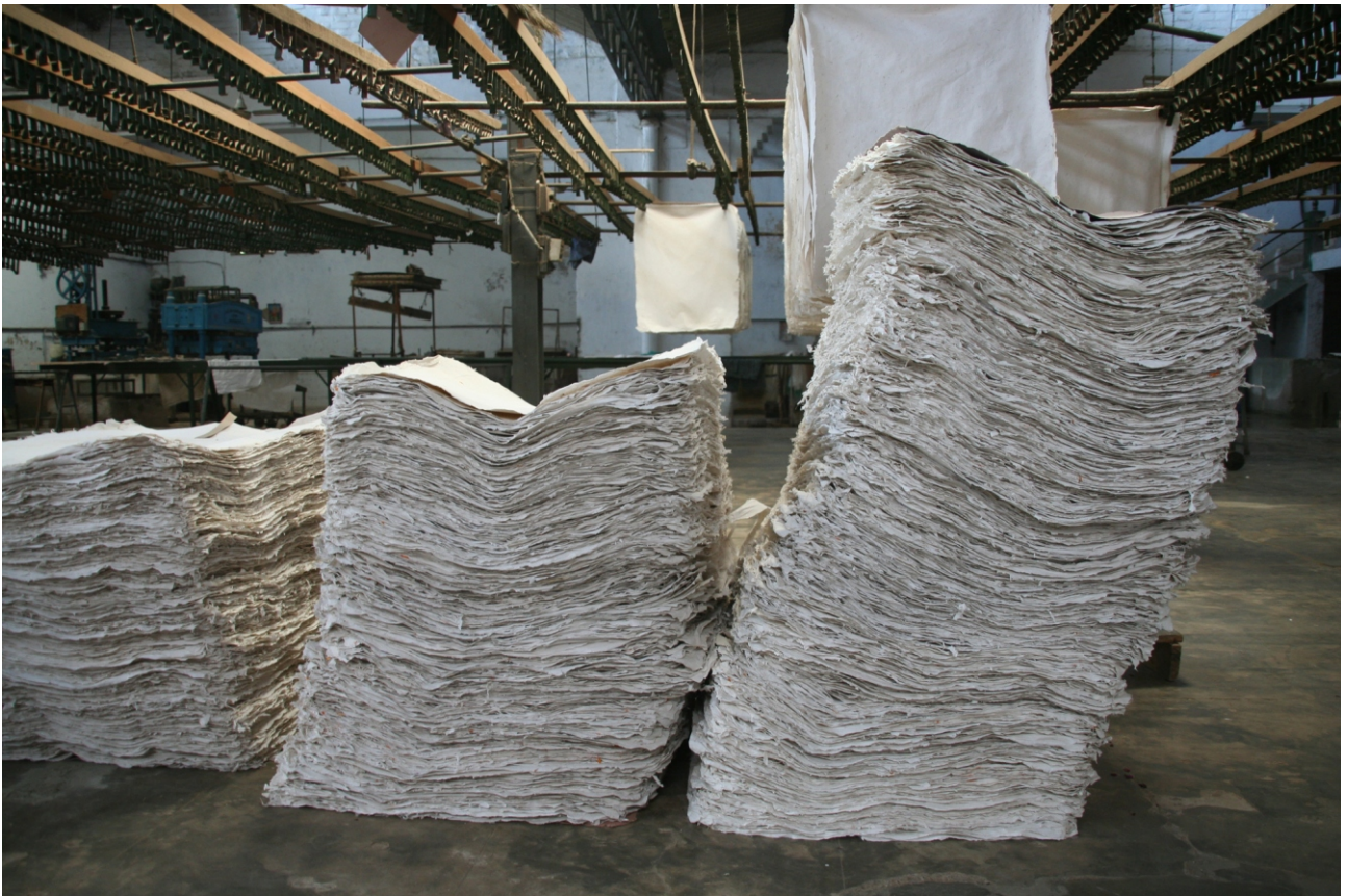
„Kalam Kush“ Werkstatt in Ahmedabad