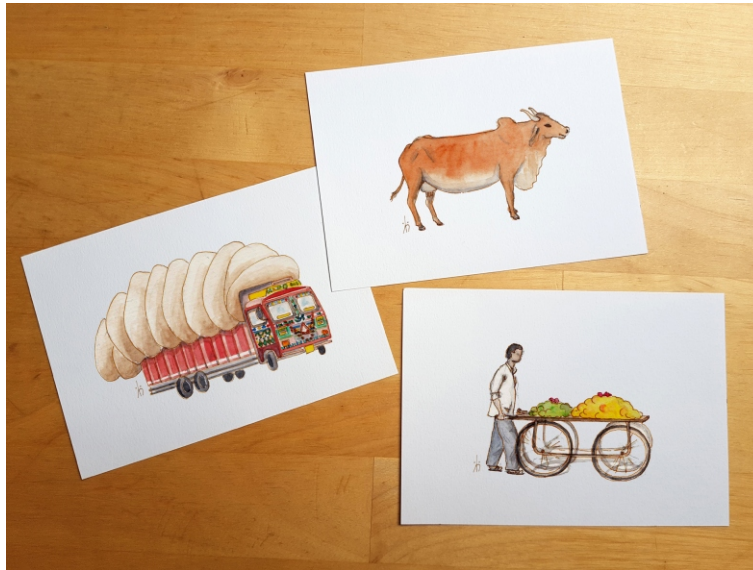
Postkarte. Klassische Reihe.