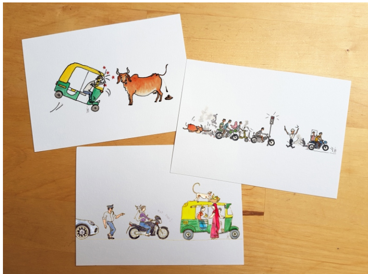
Postkarte. Fun Reihe.