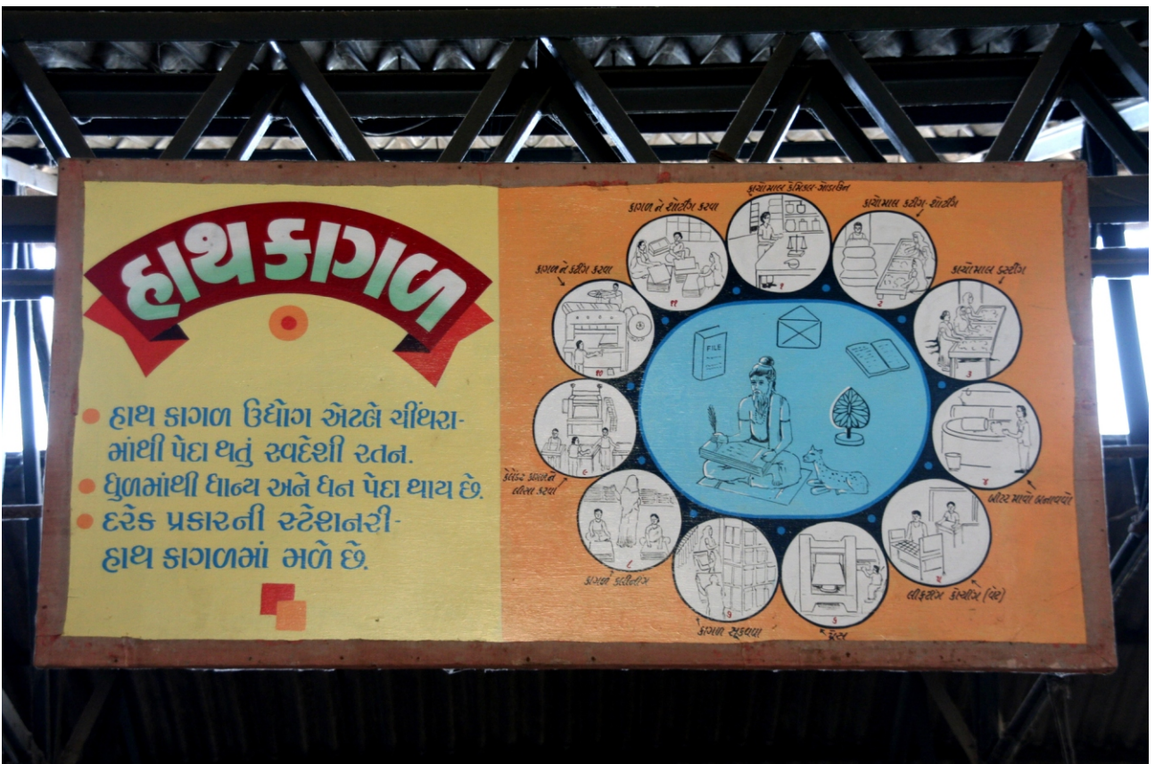
Handgefertigtes Papier vom „Kalam Kush“ Werkstatt in Ahmedabad