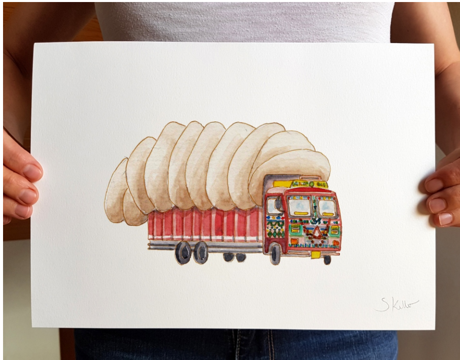
Exklusiv archiv-qualität Reproduktion „Lkw“. Kalam Kush Papier.